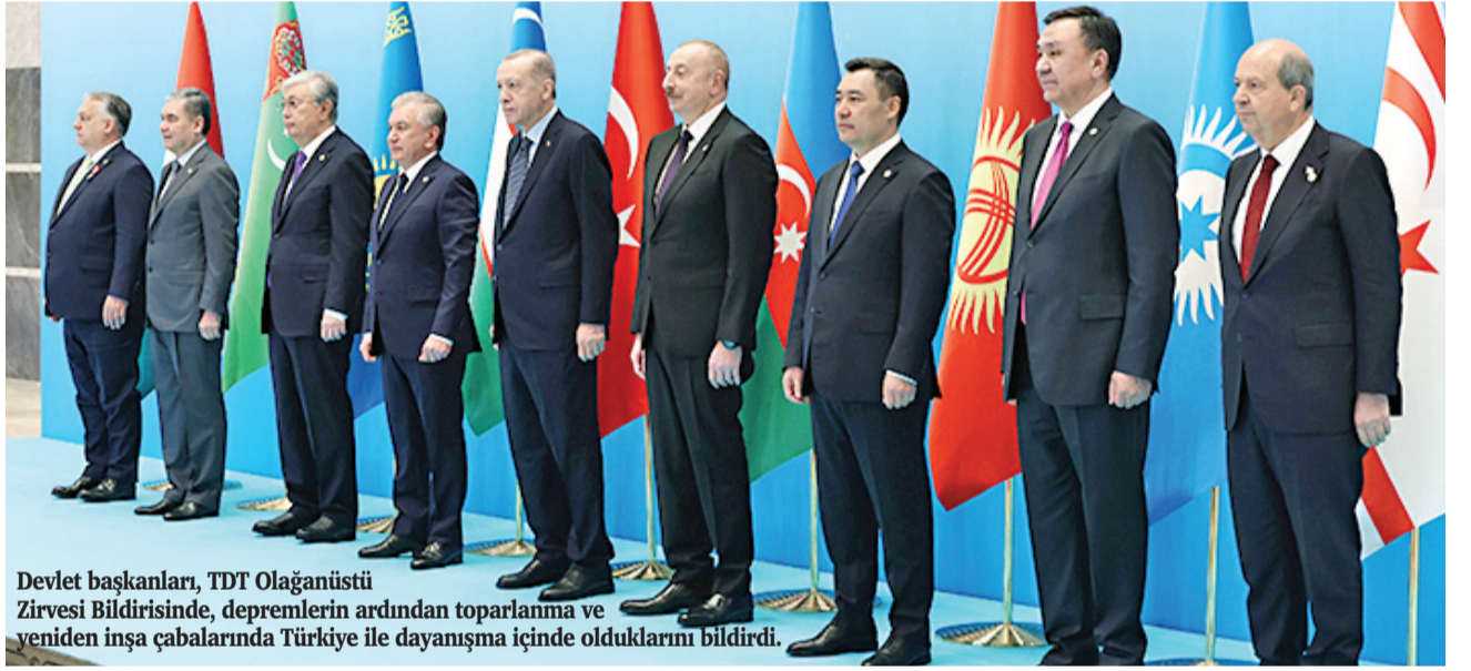
Devlet başkanları, TDT Olağanüstü Zirvesi Bildirisinde, depremlerin ardından toplanma ve yeniden inşa çabalarında Türkiye ile dayanışma içinde olduklarını bildirdi.

Bugünkü zirveyle, Türk dünyasının tek yürek, tek vücut olduğunu en üst düzeyde bir kez daha göstermiş olacağını vurgulayan Erdoğan, şunları kaydetti: "Ülkemizin güneşindeki 11 şehir, 6 Şubat günü şiddeti ve yıkıcılığı itibarıyla dünyada eşine az rastlanır bir tabii afetle sarıldı. Bu depremlerden yaklaşık 14 milyon vatandaşımız doğrudan etkilenirken, 49 binden fazla insanımız hayatını kaybetti, 115 binden fazlası yaralandı. Kendi insanlarımızla birlikte, depremde vefat eden Türk Devletleri Teşkilatı üye ve gözlemci