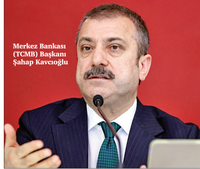
Merkez Bankası (TCMB) Başkanı Şahap Kavcıoğlu

Kavcıoğlu, 2022 yılında, fiyat istikrarının sürdürülebilir bir çerçevede yeniden şekillenmesi amacıyla tüm politika araçlarında Türk lirasını önleyen geniş kapsamlı bir politika çerçevesi gözden geçirme sürecini yürüttüklerini anlattı. Bu kapsamda, bütüncül bir yaklaşımla oluşturdukları "Liralaşma Stratejisi"ni uygulamaya koyduklarını vurgulayan Kavcıoğlu, "Liralaşma Stratejisi ile kısa vadede enflasyon ve fiyatlama davranışlarında döviz kuruna olan hassasiyeti gidermeye çalıştık. Orta vadede ise üretim ve ihracatı desteklemek suretiyle cari işlemler dengesini güçlendirmeyi hedefledik." değerlendirmesinde bulundu.