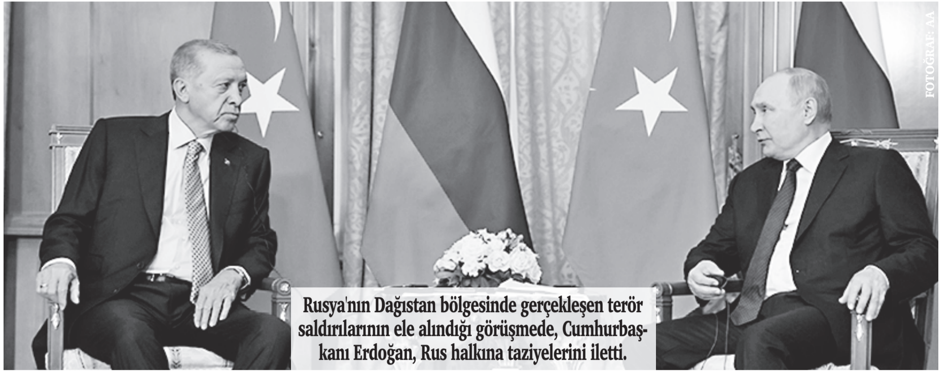
Rusya'nın Dağıstan bölgesinde gerçekleşen terör saldırılarının ele alındığı görüşmede, Cumhurbaşkanı Erdoğan, Rus halkına taziyelerini ilettiler.

Bakan Şimşek, bilinçli şekilde suni gündem oluşturulmak istendiğini belirterek, "Buna karşı biz, makrofinansal istikrarı tesis etmek, sürdürülebilir yüksek büyümeye ulaşmak için uygulamaya koyduğumuz programımıza kararlılıkla devam edeceğiz." dedi. Hazine ve Maliye Bakanı Mehmet Şimşek, bilinçli bir şekilde suni gündem oluşturulmak istendiğini belirterek, "Buna karşı biz, makrofinansal istikrarı tesis etmek, sürdürülebilir yüksek büyümeye ulaşmak ve daha adil gelir dağılımını sağlamak için uygulamaya koyduğumuz programımıza kararlılıkla devam edeceğiz." ifadesini kullandı. Şimşek, sosyal medya hesabından yaptığı paylaşımında, makam aracıyla ilgili bugün yayımlanan bir habere ilişkin, "Sözcü gazetesini memnun etmek için bisiklete binmeyi düşünebilirim." değerlendirmesini yaptı. Bakan Şimşek, şunları kaydetti: "Bilinçli şekilde oluşturulmak istenen bu suni gündeme karşı biz, makrofinansal istikrarı tesis etmek, sürdürülebilir yüksek büyümeye ulaşmak ve daha adil gelir dağılımını sağlamak için uygulamaya koyduğumuz programımıza kararlılıkla devam edeceğiz. Milletimiz müsterih olsun. Bütçede disiplini tesis ediyoruz. Cari açığı sürdürülebilir bir seviyeye çekti. Döviz rezervlerini endişe kaynağı olmaktan çıkardık. Kur korumalı mevduatı başarılı şekilde azaltıyoruz. Enflasyon yakında çok hızlı bir düşüş sürecine girecek. Ülkemizin potansiyeli çok yüksek. Bu potansiyeli ulaşmak için ekip ruhu ile aralıksız çalışıyoruz ve başaracağız." ●ANKARA-AA