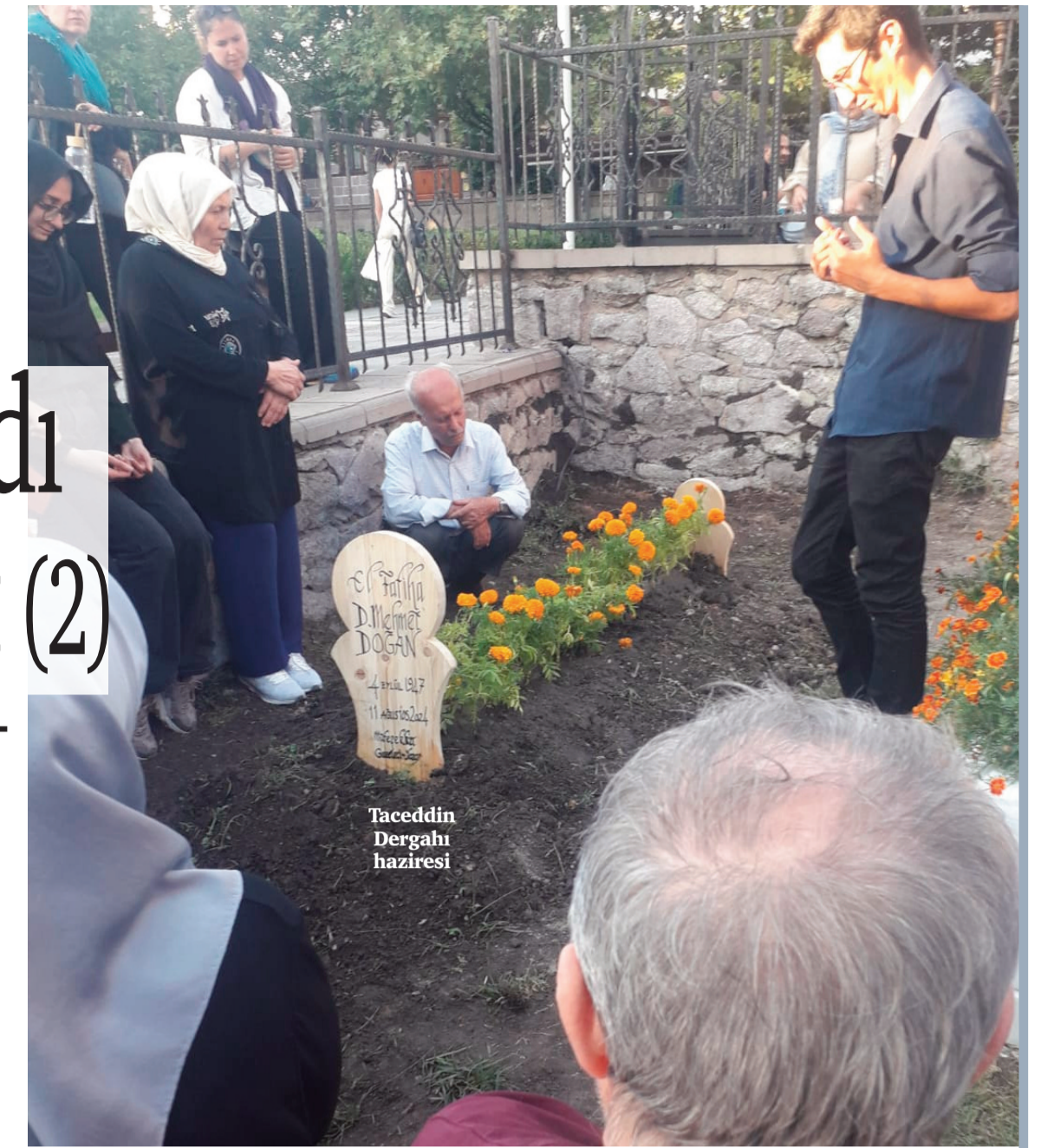
Taceddin Dergâhı haziresi

Hemen ülkemizin her yerinden aldığı davetlerle sohbet toplantıları, seminerler ve verdiği konferanslarla kültür misyonunu sürdürdü. Ülkemizde ilk defa TYB bünyesinde oluşturduğu yazar okulu marifetiyle yazarlık vasfının ne olduğunu geniş kitlelerin anlamasını sağladı. Kültür projelerinde