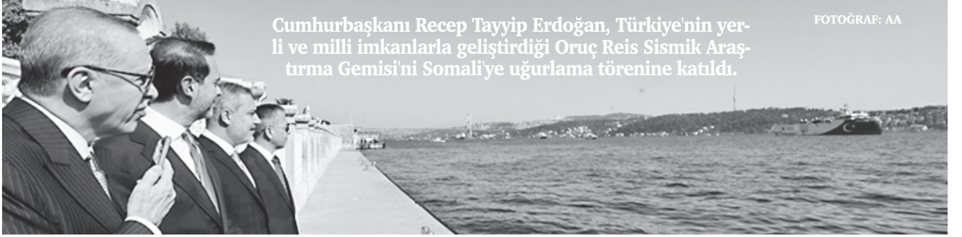
Cumhurbaşkanı Recep Tayyip Erdoğan, Türkiye'nin yerli ve milli imkanlarla geliştirdiği Oruç Reis Sismik Araştırma Gemisi'ni Somali'ye uğurlama törenine katıldı.