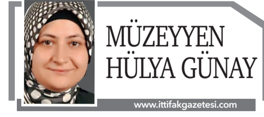
MÜZEYYEN HÜLYA GÜNAY

maray, Başkentray, İZBAN, Sirkeci-Kazlıçeşme raylı sistem hattı ile Gayrettepe-İstanbul Havalimanı-Arnavutköy metrosunu vatandaşlarımız yılbaşında ücretsiz olarak kullanacak." değerlendirmesinde bulundu. Uraloğlu, vatandaşların yeni yıla huzur ve mutlulukla girmesini dileyerek, şunları kaydetti: "Söz konusu hatlar, tüm halkımıza gün boyunca hızlı, kolay ve ekonomik bir ulaşım imkanı sağlayacak. Yılbaşında ücretsiz ulaşım hizmetimize vatandaşlarımızı kolaylık sağlayarak yeni yıl sevincine ortak ediyoruz." ●ANKARA-AA