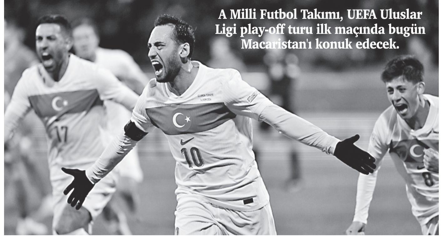
A Milli Futbol Takımı, UEFA Uluslar Ligi play-off turu ilk maçında bugün Macaristan'ı konuk edecek.