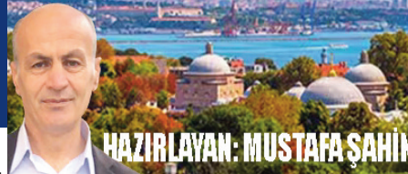
HAZIRLAYAN: MUSTAFA ŞAHİN